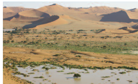
Mit Wasser gefüllte Vlei's

Die hier aufgeführte Reiseroute soll eine Idee der vielen Möglichkeiten aufzeigen. Die Durchführung ist abhängig von der Verfügbarkeit der Lodges und Camps!